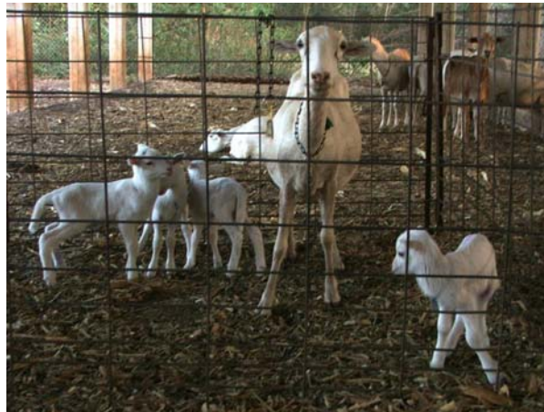
Foto 1. Oveja con cuatrillizos producto de una buena preparación al empadre.

El apareamiento o empadre es la acción de juntar los carneros con las ovejas para que éstas sean servidas o apareadas y tengan crías. Al tiempo que permanecerán los carneros con las ovejas por decisión del productor o técnico se le conoce como época de empadre .