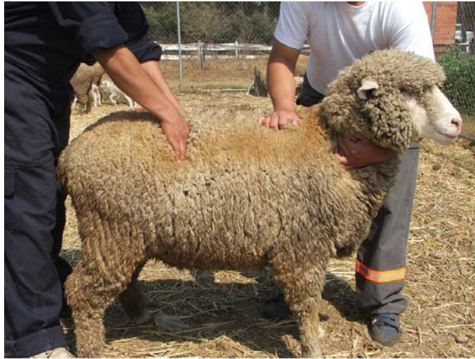
Foto 2. Evaluación de la condición corporal, palpando la región lumbar

Si la revisión muestra que las ovejas están flacas lo que pasará es que tardarán más en quedar cargadas y tendrán menos corderos. Para corregir esto se debe dar una buena alimentación, que permita mejorar el estado de carnes (que gane peso), esto aumenta la fertilidad (ovejas cargadas) y la cantidad de corderos que nazcan (prolificidad).