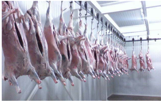
Canales ovinas

Es preferible expresar el rendimiento en canal fría para evitar la variación que se presenta cuando la canal va perdiendo temperatura a medida que se va enfriando; por esto, se recomienda determinar el rendimiento en la canal refrigerada a 4 °C durante 24 h.