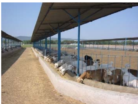
Producción ovina en estabulación

El sistema de alimentación afecta la calidad de la canal, porque incide sobre el consumo de alimento y modifica el volumen del tubo digestivo de los ovinos, influyendo sobre la velocidad de crecimiento y el tiempo en que un animal alcanza su peso maduro. Esto repercute en forma directa sobre el rendimiento y la composición de la canal, ya que la acumulación de los tejidos es variable con la edad. A mayor edad, mayor es la deposición de grasa a costa del tejido muscular.