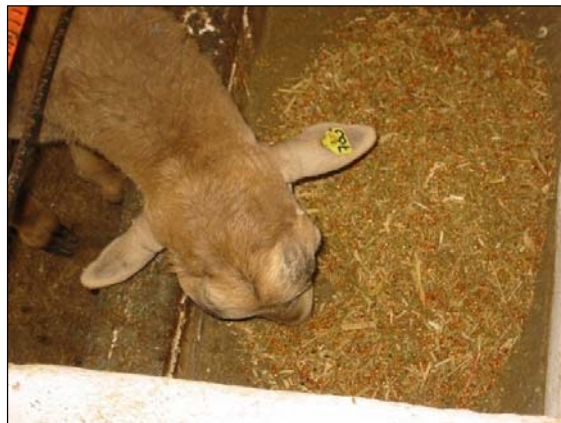
Dieta integral en estabulación

La densidad de energía de la dieta también puede afectar el estado de engrasamiento de la canal y el color de la grasa cavitaria y de cobertura.