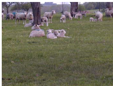
Producción ovina en pastoreo